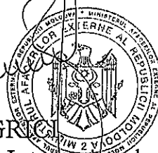
Violeta AGR Șefa Direcției Drept Internațional a Ministerului Afacerilor Externe